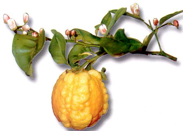
Citrus Aurantium Bizarria