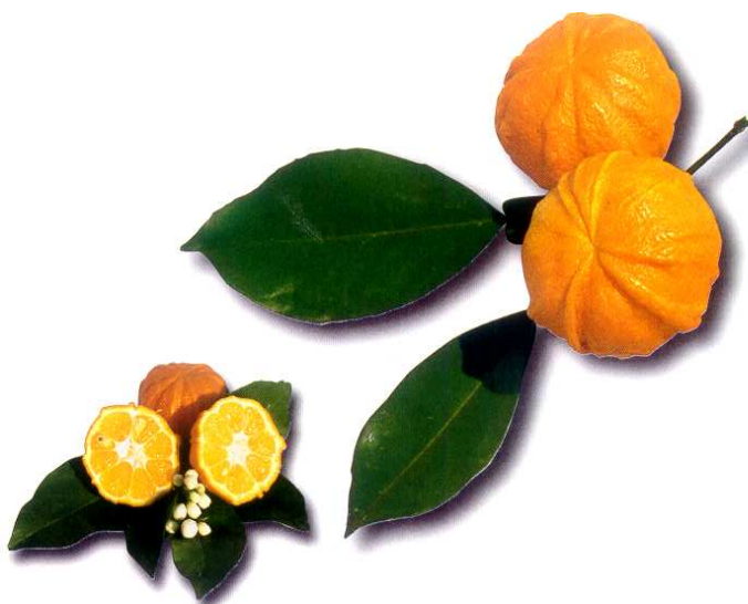
Citrus Aurantium "Canaliculata" Arancio Scannellato