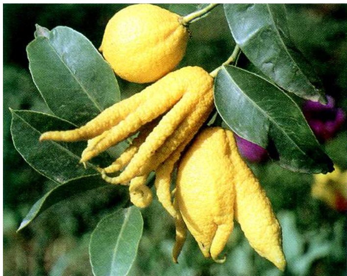
Citrus Limon Digitata Limone del Fior Doppio Bizarro