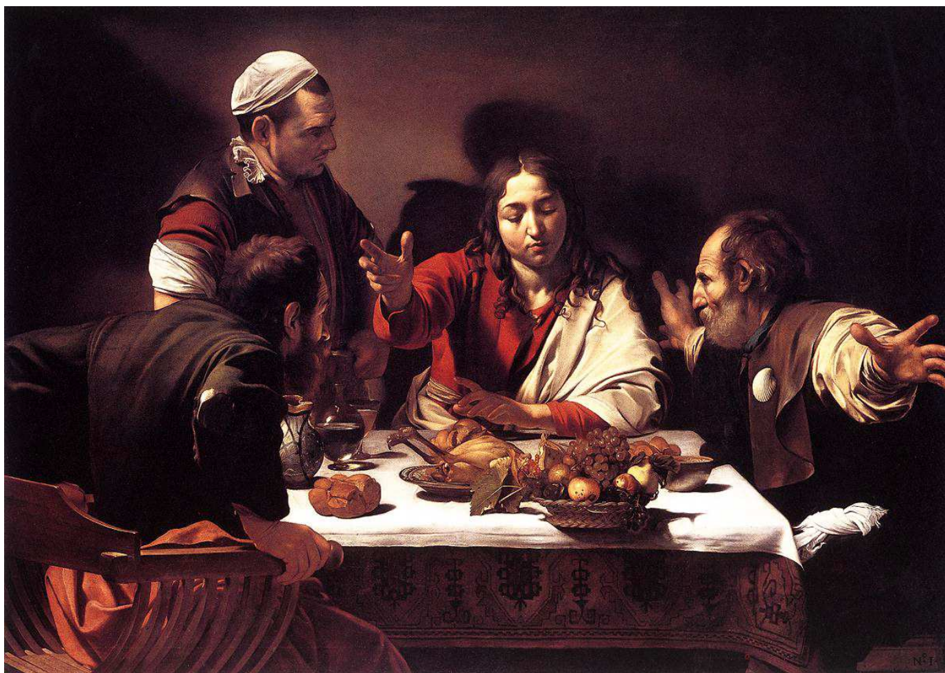
Caravaggio, Cena ad Emmaus , olio su tela, 1601-02, National Gallery, Londra.

Confronta il quadro che hai davanti con questa riproduzione della Cena ad Emmaus del Caravaggio: quali sono le differenze?