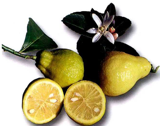
Citrus Limon "Peretta" Peretta dal Fior Doppio